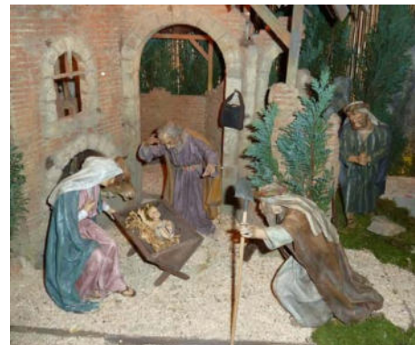
Weihnachtskrippe in Oberstadion

Die Engel lenken unseren Blick nicht nur nach oben, zum Himmel, woher Rettung erwartet wird, sondern sie lenken unseren Blick zugleich nach unten: zum Kind in der Krippe, dem wir nun mit den Versen von Paul Gerhardt (Gotteslob Nr. 256) begegnen können: Ich lag in tiefster Todesnacht, Du warest meine Sonne, die Sonne, die mir zugebracht, Licht Leben, Freud und Wonne.